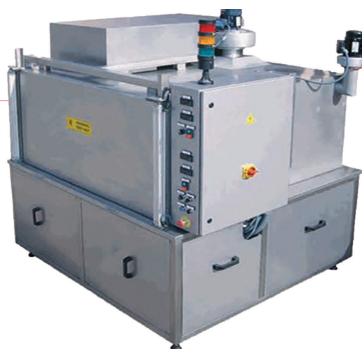
Alpha Spray Cleaner met frond loading