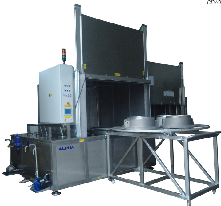
Alpha Spray Cleaner - 90 - WR