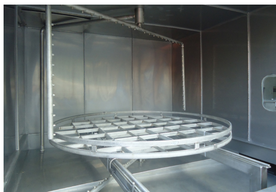
Roterend nozzlesysteem (bij laadvermogen > 1000 kg en/of automatische lading van mand)